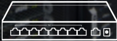
TL-SF1009P ( Extend Mode Off )