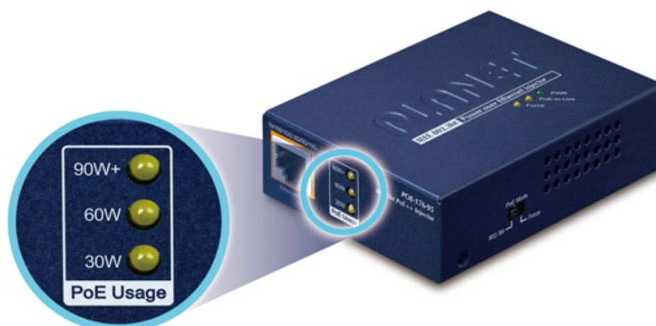
PoE Power Usage Display