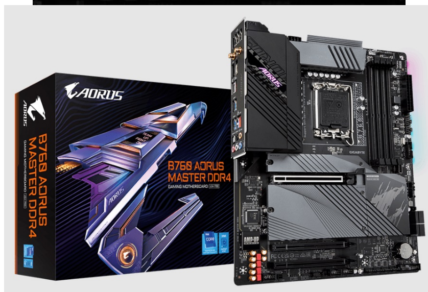
GIGABYTE B760 AORUS MASTER DDR4