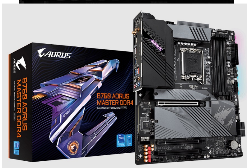
GIGABYTE B760 AORUS MASTER DDR4