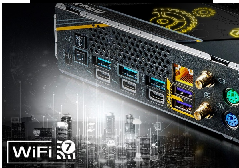
ASRock Z890 Taichi OC Formula