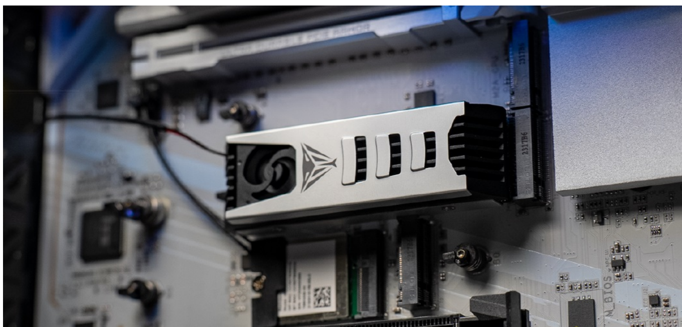
Patriot Viper PV573 4 TB

SSD disk Patriot Viper PV573 umožňuje streamerům, hráčům a profesionálům dělat to, co umí, naplno a bez obav z pádu systému. Model Patriot Viper PV573 disponuje technologemi pro ochranu dat a korekci chyb . Podporuje tak neporušenost uložených souborů ve 4TB úložišti a dlouhou životnost celého disku.