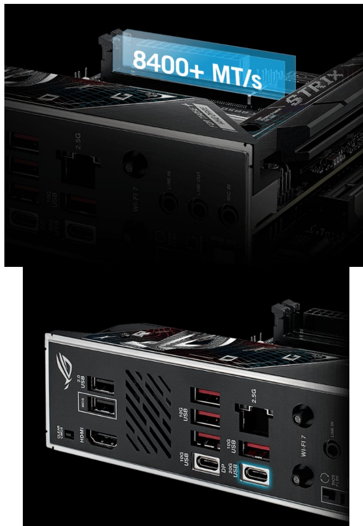
ASUS ROG STRIX B850-I GAMING WIFI

Kombinace WiFi 7 a Intel 2,5Gigabit LAN zajistí rychlost a spolehlivé připojení pro on-line gaming nebo činnost s on-line nástroji na rozmanitých projektech. Porty USB umožňují rychlý přenos dat a podporu nejnovějších periférií. Díky pokročilemu DIY designu deska usnadňuje montáž a celkovou správu a stavitelům PC při skládání neudělá těžkou hlavu.