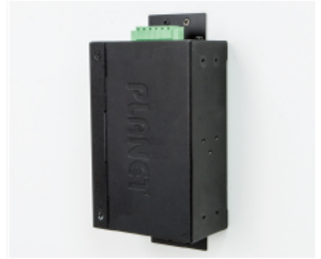
Side Wall Mounting (Space saving)