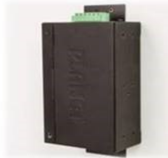
Wall mounting (Space saving)