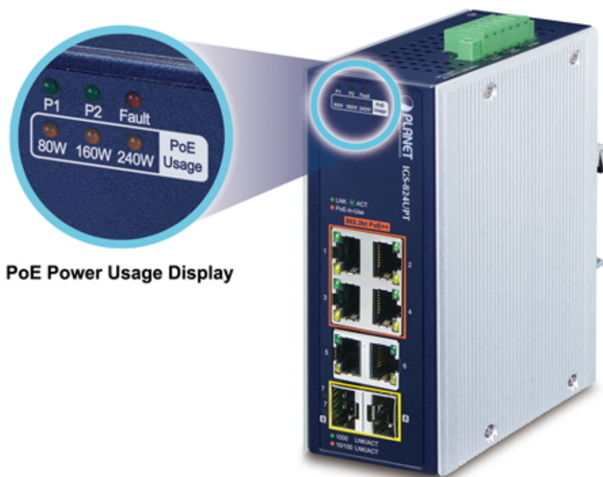
PoE Power Usage Display