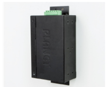
Side Wall Mounting (Space saving)