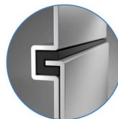
Sealed Lock-and-Key Design

Na zadní straně je k dispozici celá řada portů, mezi nimiž vyčnívá především rozhraní HDMI 2.0 , které zajistí snadné promítání 4K obsahu při vyšším jasu a kontrastu oproti standardnímu rozlišení. Jas je klíčem k viditelnosti. I proto nabízí projektor BenQ LU9245 funkci dynamického tlumení jasu dle scény a optimalizuje světelný výkon a kontrast pro co nejlepší obraz.