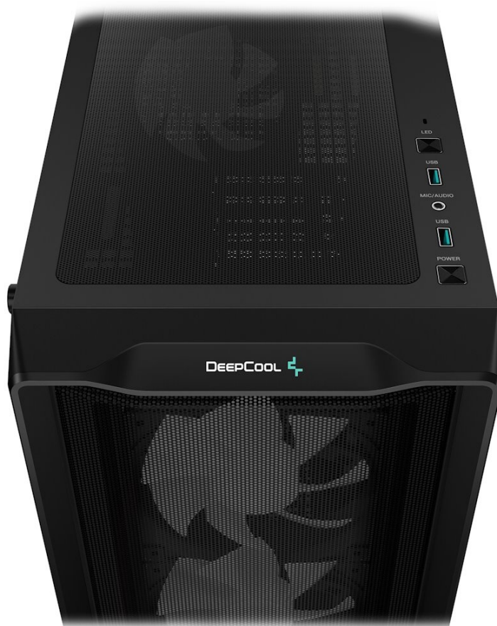
DEEPCOOL CC560 MESH V2

Skříň DEEPCOOL CC560 MESH V2 disponuje také 4 předinstalovanými ventilátory s ARGB podsvícením , které se postarají o efektivní chlazení a stylový vzhled. Na horním panelu se nachází základní ovládání a také konektory pro připojení periferních zařízení.