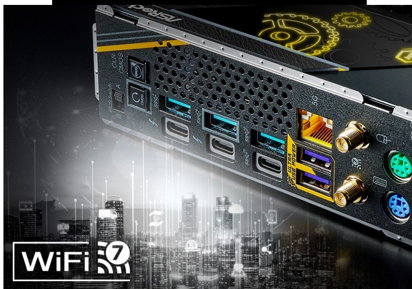
ASRock Z890 Taichi OC Formula