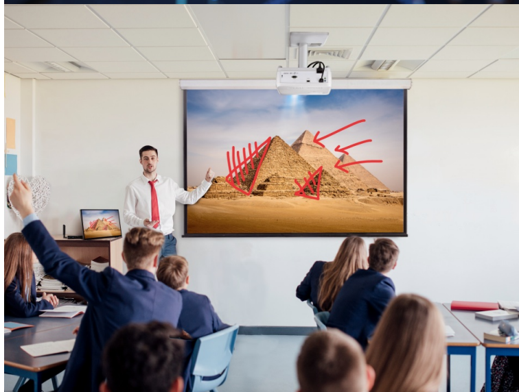
ViewSonic ViewBoard Box VBS200-A